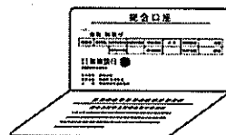
通帳を開いた 1.2 ページ目